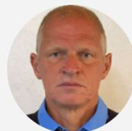
Bert Huis Regio aanspreekpunt / LNV/RVO